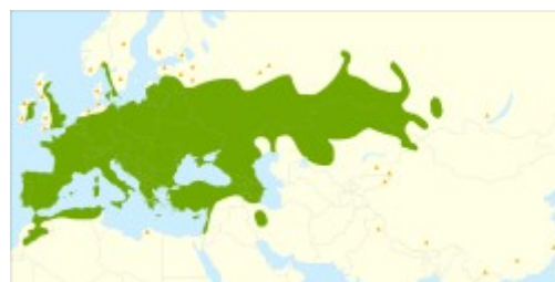
Distribución del sauce blanco.