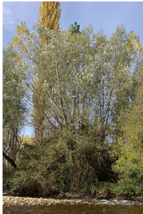
Vista del árbol.