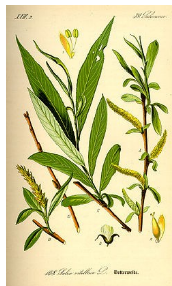
Ilustración de Salix alba .