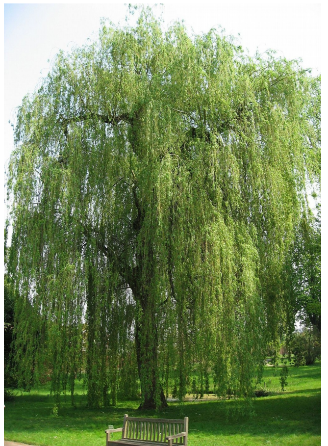
Salix alba Tristis